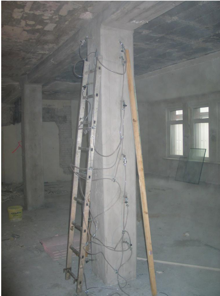
Abb.1: Infusion einer Stütze

Besondere Bedeutung kam im konkreten Fall den Lastdurchleitungsbereichen zu, die gleichermaßen behandelt bzw. durchtränkt wurden.